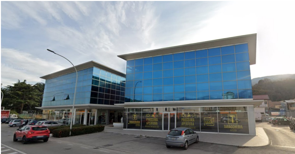
La nuova sede di Vero Solutions Srl ad Ascoli Piceno nel palazzo Sabatini