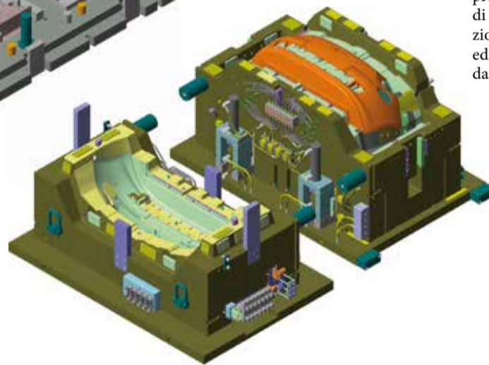
Da sinistra, stampo lamiera e stampo plastica